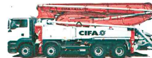
Схема раскладки автобетононасоса